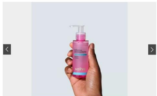
CLEANSING OIL: OPÇÕES PARA VOCÊ