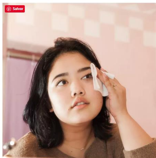
Double cleansing: tudo sobre a técnica de limpeza facial japonesa

O ritual atingiu o pico de pesquisas globais no Google em fevereiro deste ano e tornou-se um dos passos mais presentes na rotina de cuidados com a pele durante a quarentena . Mas como fazer?