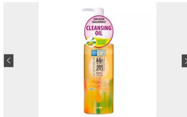
CLEANSING OIL: OPÇÕES PARA VOCÊ