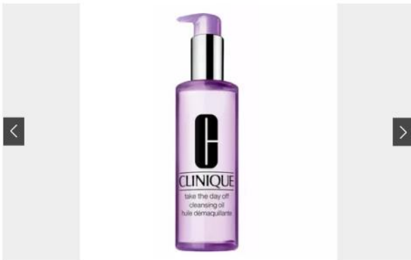
CLEANSING OIL: OPÇÕES PARA VOCÊ