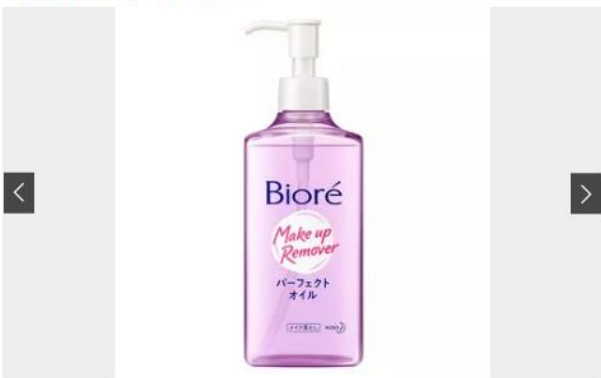
CLEANSING OIL: OPÇÕES PARA VOCÊ