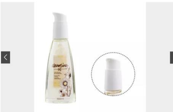
CLEANSING OIL: OPÇÕES PARA VOCÊ