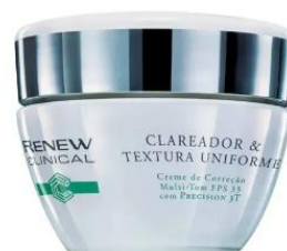
Creme de Correção Renew Clinical Multitom FFS 33, R$ 77,00

"Caso você queira, pode realizar laser fracionado não ablativo (raios focados em melhorar a textura da pele e deixar um aspecto mais saudável e jovial) e laser Nd:YAG